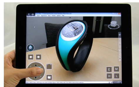
在 iPad 上使用自訂控制項進行 3D CAD/CAM